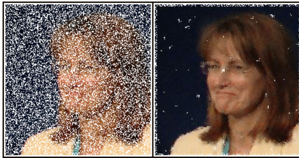
(a) Débruitage